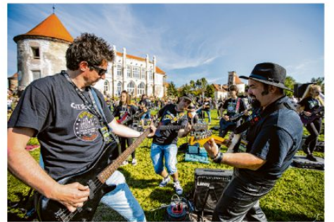
Többek között Queen-, Depeche Mode- és Billy Idol-számokat adott elő a mintegy 150 zenész a kastélykertben.